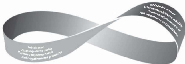
Obrázok 2: Mobiova páska, ktorá má len jednu stranu a jednu hranu.